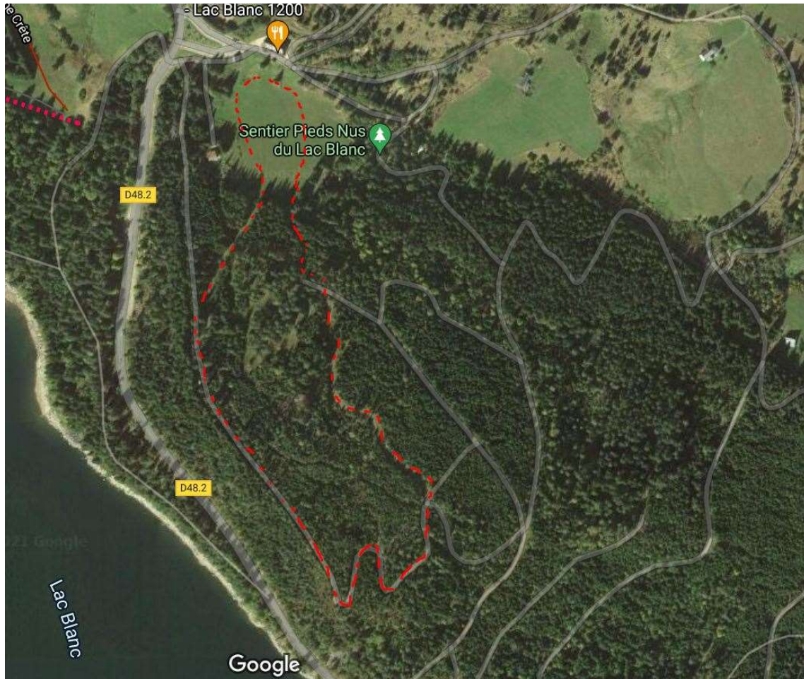
Piste bleue n°2– Les Balcons du Lac Blanc- 2km , D+ 45m.